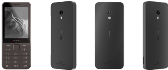
Nokia 235 | Farbe: Kommunikation Black