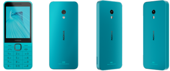
Nokia 235 | Farbe: Kommunikation Blue