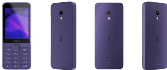
Nokia 235 | Farbe: Kommunikation Purple